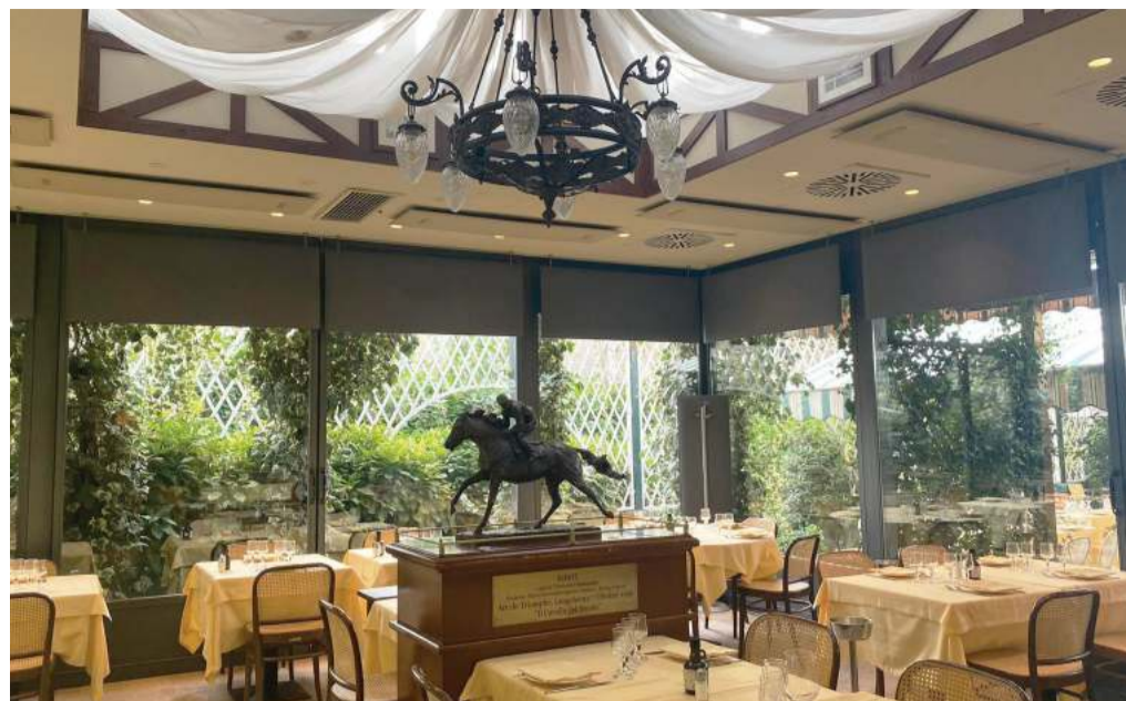
La scultura nel centro della sala ristorante Ribot