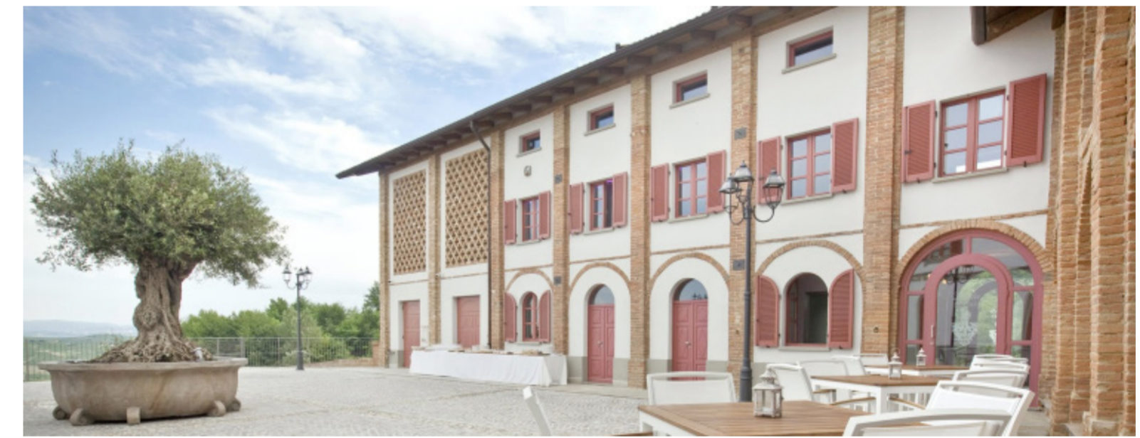
Villa Prato Relais

66 La realizzazione dei vostri sogni è sempre stato il nostro più grande obiettivo. Oggi lo è ancora di più. In questi mesi abbiamo creato un luogo sicuro per voi e per noi. 99